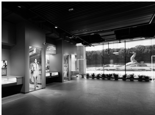
场馆外的无名烈士墓

的烈士精神呈现形成呼应，使观众更加深刻地感受到烈士的英勇和牺牲，同时还展示了江南地区独特的文化底蕴。