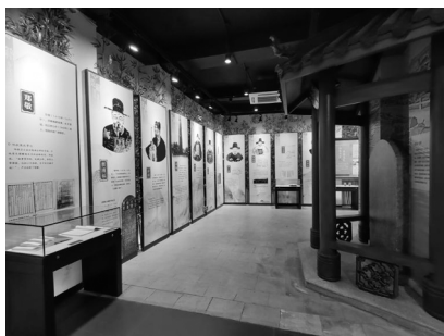
东莞市袁崇焕纪念园“清风之德——东莞廉文化展”实景照