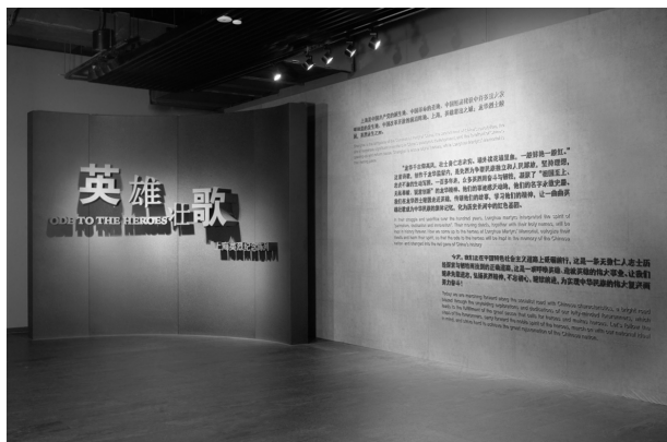
龙华烈士陵园展览标题展示区

城市以上海为例，上海的城市文化主要有“海派文化”“红色文化”和“江南文化”；上海的城市精神则为“海纳百川”“追求卓越”“开明睿智”和“大气谦和”。人物类场馆以上海市龙华烈士陵园为例，龙华烈士陵园作为群体型人物类场馆，展览标题为“英雄壮歌——上海