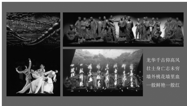
展项“二十四烈士雕塑多媒体剧场”

四烈士的不同人物事迹和精神，设置人物群雕场景，通过高低前后的总体构图，很好地反映了主题人物的个性和气质，具有很强的现场震撼力，是龙华二十四烈士英雄气概的集中反映。展项在雕塑的基础上，又首次采用现代舞的形式阐释英烈精神的内容，通过视频、朗诵、音乐、灯光、全息等多媒体结合，演示了二十四烈士工作、生活、牺牲和被缅怀的画面，反映了二十四烈士由生而死、死而永生的感人事迹和史诗般的英雄壮歌。这一展项无疑是展览主题的完美呈现，人物的精神与城市红色文化融合在一起。作为纪念馆，整个场馆某种程度上都是上海红色文化的缩影。