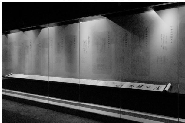
东莞市袁崇焕纪念园“《肤公雅奏图诗画卷》解构展”实景图

与创新——东莞明末清初青花瓷器精品展”，我们又邀请了景德镇御窑博物院的知名专家对展览进行全程指导和把关。正因为有各位知名专家的悉心指导和全程把关，纪念园才有信心继续推进展览的制作；也正因为有专家的把关指导，展览才有一定的学术含量，才能被同行和社会所认可。