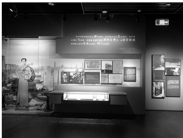
陈延年展区玻璃刻画的江南水乡背景

龙华烈士纪念馆中使用了多幅人物题材玻璃刻画作品。与玻璃刻画相伴的，都制作了对应的人物行动场景，部分使用了江南水乡场景，江南水乡的背景也能够与烈士的事迹相呼应。他们的英雄事迹与江南水乡的宁静、美丽形成鲜明的对比。这种对比能够更加凸显他们的伟大和牺