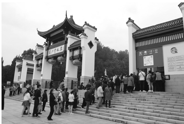
2020年9月，游客扫码预约后进入花明楼景区参观