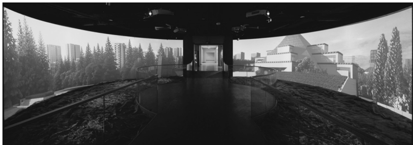
展项“尾厅‘仰望’多媒体360°环幕剧场”

“尾厅‘仰望’多媒体360°环幕剧场”展项是开放式的环幕剧场。视频整体选取了龙华主题音乐和极具视觉冲击力的画面，视频的主题是“英烈——城市的繁星照亮上海”，英烈的付出迎来了上海创新之城、人文之城、生态之城的成果和远景。走进展厅之中，可以重温烈士的精神，感受到英雄城市孕育英雄，英雄激励后人奋进、继续建设英雄城市的情怀，是对英烈精神的重温，也是参观情绪的舒缓释放。在尾厅这一展项上，观众可以从整体感受到“海纳百川”“追求卓越”“开明睿智”和“大气谦和”的上海城市精神。