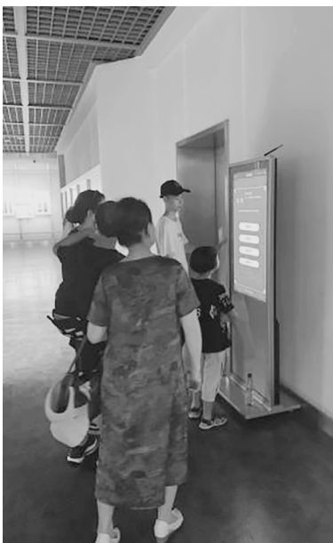
图 2 党史学习答题一体机

进入 21 世纪后，信息技术在文物与博物馆界的运用越发广泛和成熟。因此，一方面，可引进成熟的信息技术到博物馆教育中，通过精心的内容编排和教育设置，搭建移动端小程序或其他现场设备来寓教于乐。比如，长沙简牍博物馆与超星集团联合研发了“猜灯谜”的电子互